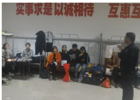
图 4-3 早会学习内容安排