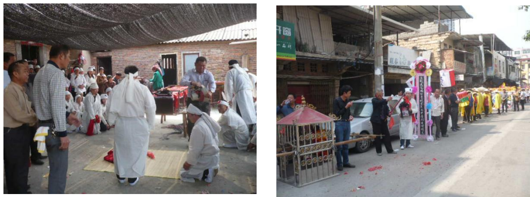
图 4-5 学生调查的殡葬习俗

【案例介绍 2】《园林工程》课程从教室走进工地，以学生分组项目制带动其学习积极性，提升学生的实践能力，通过企业的实践教学来实现课堂教学内容和方式的创新改革。