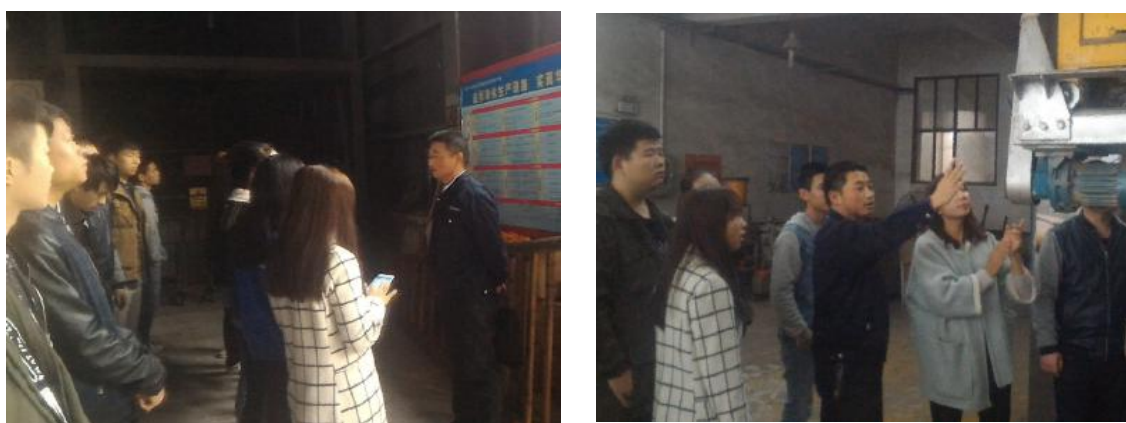
图 3-8 学生在企业上课

学生课堂进企业:通过学院防腐设备教研室与华望科技股份有限公司共同研究确定课程安排，实行理论教学与定岗实训相结合，学校老师与企业专家双师资教学的方式。将上课学生分为两组，一组进入普通卫生棺，一组分到高档卫生棺，然后进行实训学习岗位互换，其间穿插理论知识回顾，学习过程中针对学生存在的疑惑及时分析讲授。每天课程分为早课内容安排、车间实训实践学习与讲解、晚课学习内容总结回顾及实训课程企业老师总结。