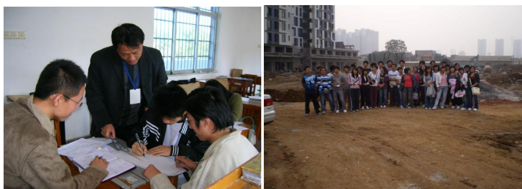
图 4-6 陵园专业的项目教学现场图

为了进一步完善“教学—实习—就业”为一体的实践教学，真正实现校企“零距离”对接，使人才培养符合企业需要；同时提高企业对学生的认可程度，拓宽学生就业渠道，实现实习与就业一体化并提高就业质量，陵园专业《园林工程》课程改变了以往在校内机房实操训练传统，将实训课带到园林工地。去工地之前，将学生进行分组，并将学习的内容划分为几个项目，每个项目联系企业的工程师进行现场指导，回校后进行汇报和交流。通过这种实践教学方式的改革，学生大大的提升了动手能力，锻炼了专业素质，提前与企业行业的具体工作内容进行了衔接式学生，同时也协助企业完成部分工程的基础工作，为校企合作注入了新的形式和内容。