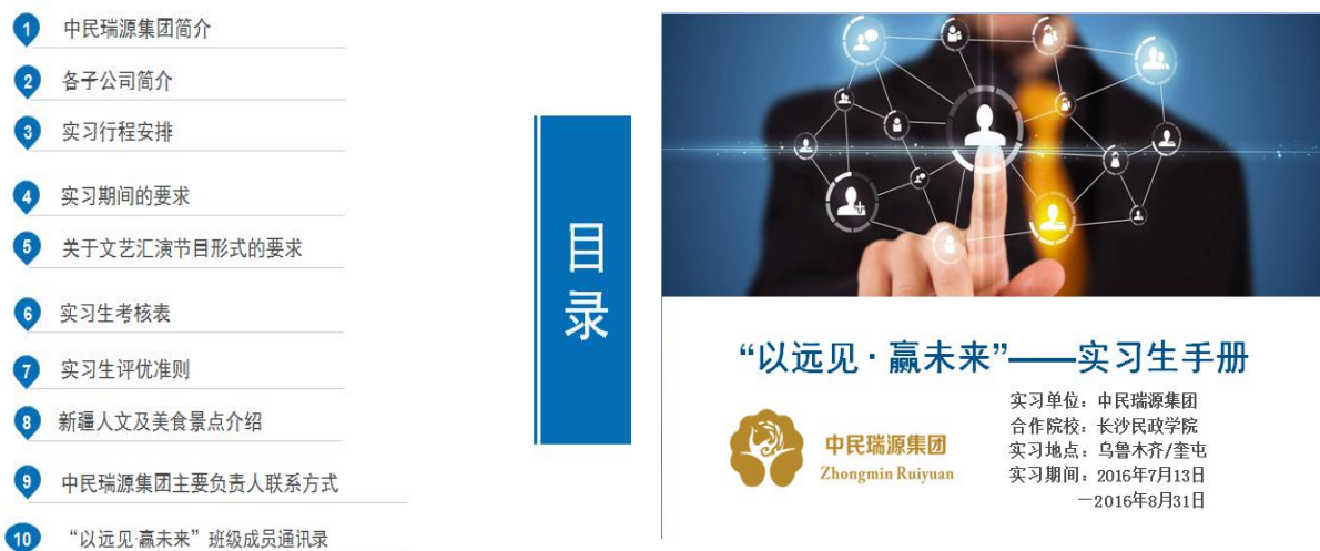
图 3-5 学生实习守则截图