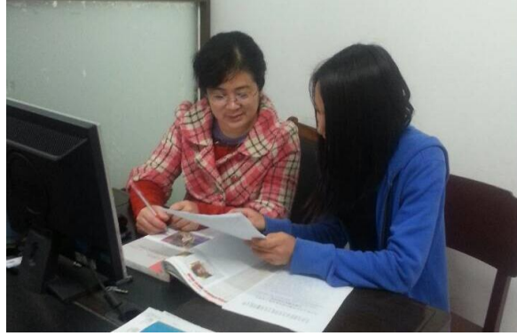
图 4-2 文秘专业学生在文化传播学院学工部顶岗见习