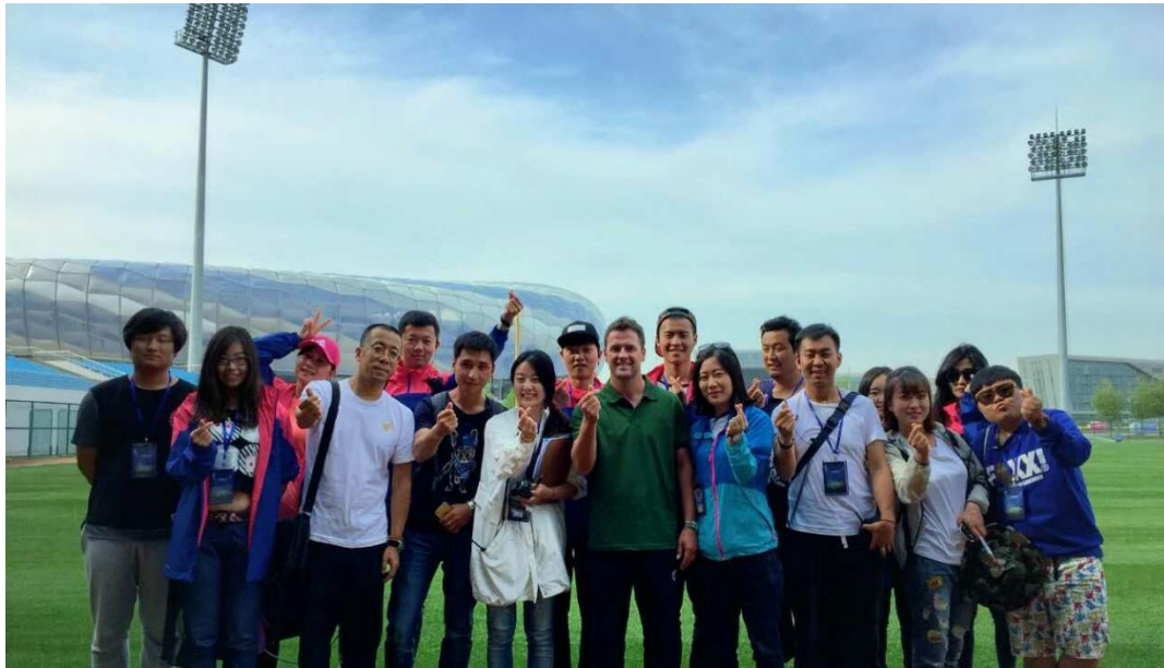
图 3-6 影视编导专业团队为山东卫视《下一个星球》提供节目制作技术服务

划制作等技术合作服务。10余名学生毕业后直接留在合作企业工作，实现了“育人”“用人”的直接过渡。