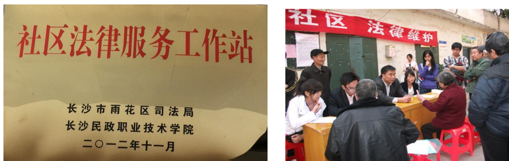
图 7-2 法律事务专业学生在雅塘村社区开展法律服务

2005 年 11 月，法律事务专业与长沙市天心区司法局联盟成立长沙民政职业技术学院法律援助工作站（后改为法律服务中心），在雅塘村社区、三湘社区、德馨园等社区开展普法宣传、法律咨询、法律援助、人民调解、法律培训等法律服务。2009 年 6 月，与长沙市政法委签订了为期四年的法律援助《战略合作协议》，2012 年 11 月与长沙市雨花区司法局合作，建立 18 个社区法律服务中心，在雨花区辖区挂牌开展法律服务活动。10 多年来，共接待社区居民法律咨询 5872 人次、发放法制宣传资料 2 万多份、调解民事纠纷 200 多件、办理法律援助案件 120 多件，探索出了高校与司法系统合作开展社区法律服务平台的路径和方法，得到了长沙市政法委、长沙市司法局等部门的高度肯定和表彰（2012 年被长沙市政法委授予“普法宣传”先进单位）。学生法律职业技能得到全面提升，社区居民的法律意识显著增强，维护了弱势群体的合法权益，促进了社会和谐稳定。