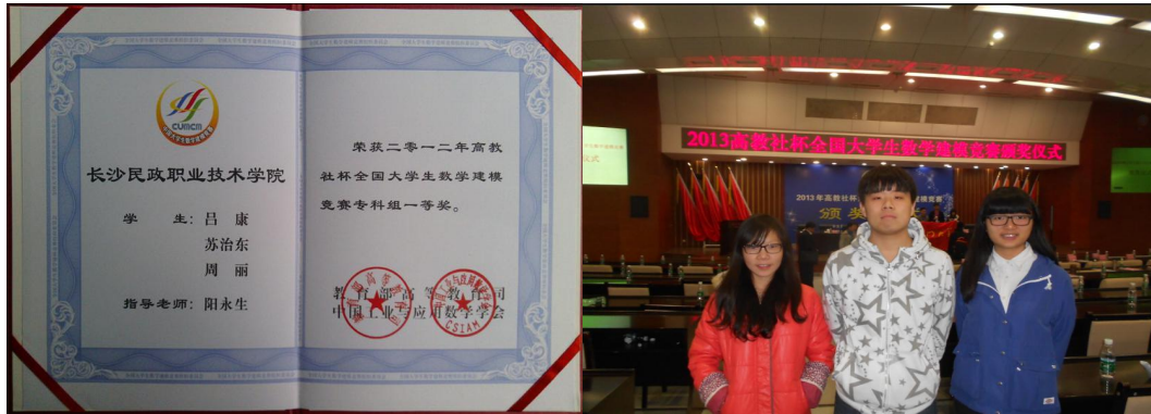
图 3-1 2012 年获奖证书与照片