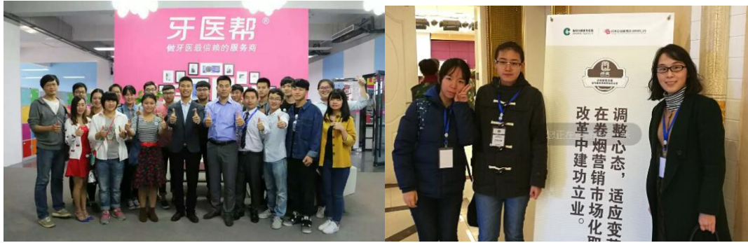
图 3-5 传播专业教学团队深入牙医帮、长沙成悟企管有限公司提供技术支持与服务