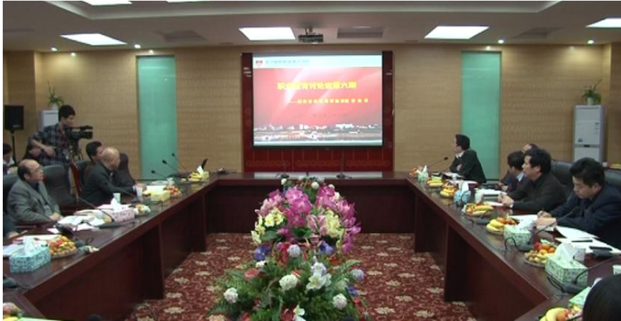
图 4-3 “经济数学”课程改革研讨会现场