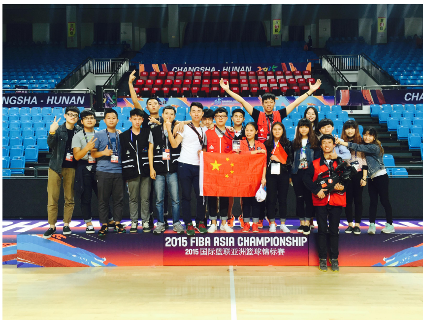
图 7-1 传媒系翼启传媒团队拍摄亚锦赛

2015 年,第 28 届亚洲男子篮球锦标赛期间,传媒系翼启传媒团队 30 余人为赛事提供体育展示现场直播、赛事信号制作摄像助理、赛事节目制作现场导演助理及媒体接待等多项技术服务,获得赛事组委会、CCTV5 等多家单位的高度赞誉。2015-2016 年,翼启传媒团队还与湖南教育电视台、湖南玩美假日文化传播公司合作,独立承制了 5 部国学系列微电影,获得积极良好的社会反响。