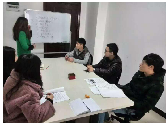
图 4-1 传媒系学生参与合作企业“牙医帮”专家访谈与互联网传播项目