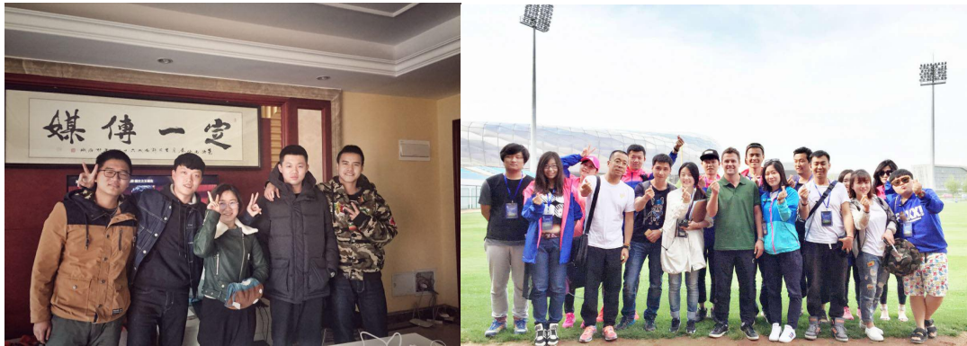
图 3-2 传媒系毕业生任职于定一传媒并参与《下一个球星》节目制作

我们输送了 10 余名学生前往校外实训基地开展学习实践活动，学生们参与策划并制作了湖南卫视《真正男子汉》《头号惊喜》、浙江卫视《西游奇遇记》、山东卫视《下一个球星》、芒果 TV《超级女声》等多档节目。2016 年，定一传媒聘用了我系 4 名应届毕业生，从事节目策划、前期导演等工作，被聘学生获得了企业的一致好评。