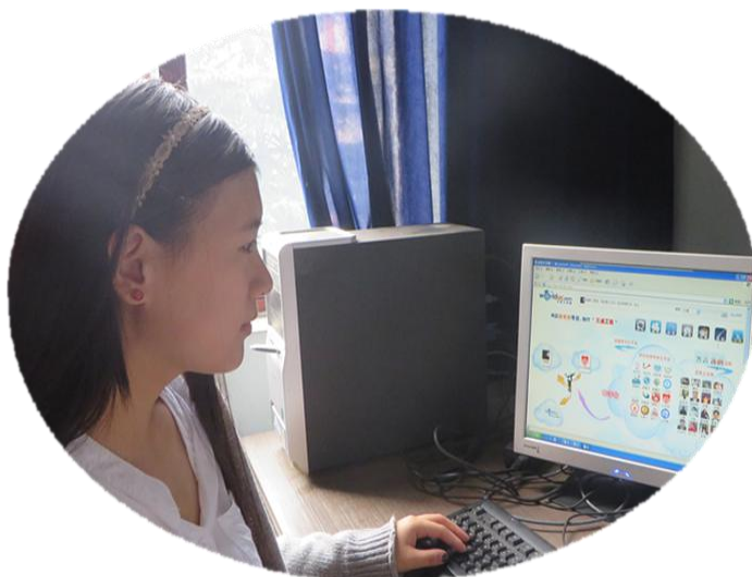
图 4-6 学生进行空间学习

根据高职学生的学习特点和认知规律,《大学人文基础》名师空间课堂项目组开发了一系列优质数字化课程资源,形式简洁、清晰明了、视觉优美、内容丰富、知识实用。本课程所有精选资源全部链接在一个网页上,形成“一览无余、一网打尽”资源共享模式。同时,在教学中引入竞争学习的理念,设立“空间自选作业秒杀区”,创设“空间秒杀——范本学习——小组研讨——学生主讲——师生评论——空间展示”线上线下混合式“六步走”教学模式,大大激发了学生的学习兴趣 and 参与热情,提高了教与学的效果。