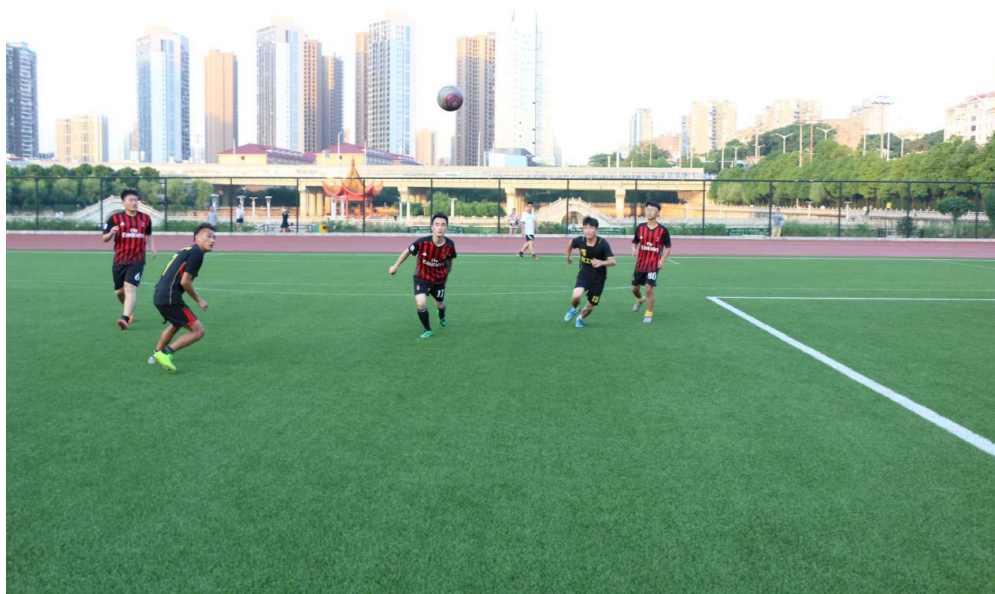
图 5-1 文化传播学院足球队在激战