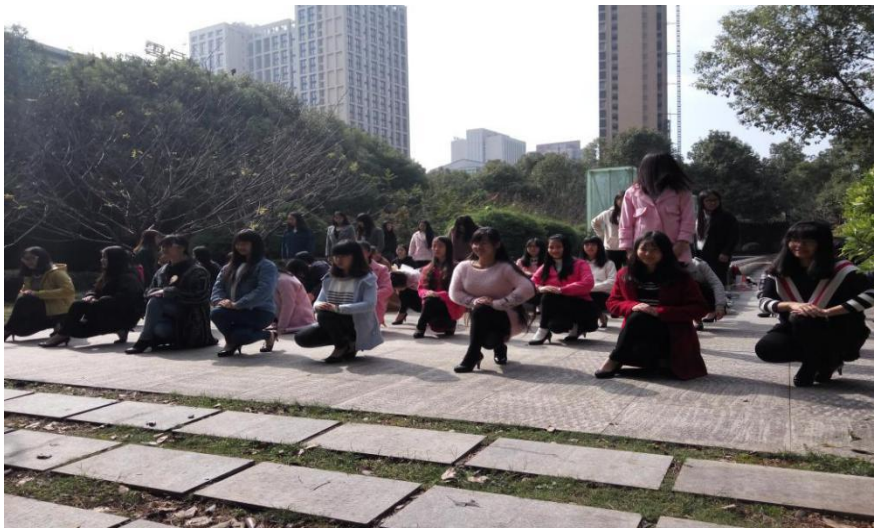
图 5-2 学生参加礼仪训练

长沙民政职业技术学院文化传播学院秘书协会于2015年12月，在时代广场开展了文秘协会2016级礼仪培训活动，并取得了圆满成功！文秘协会是一个大一文秘新生展示自己的平台，几乎每个文秘专业的同学都加入了文秘协会，每年也都会举办文秘协会活动。在这次的文秘协会活动中，大二的三位负责人及大一新生为了本次活动的顺利开展，从11月初就开始了筹划准备。文秘班的妹子们都积极参与了为期一个月的刻苦训练。此活动由秘书协会主办。以礼谊培训为中心，旨在使学生对礼谊的深入了解，使同学在日常生活中用好礼谊，对礼谊做到“学礼，懂礼，用好礼”。