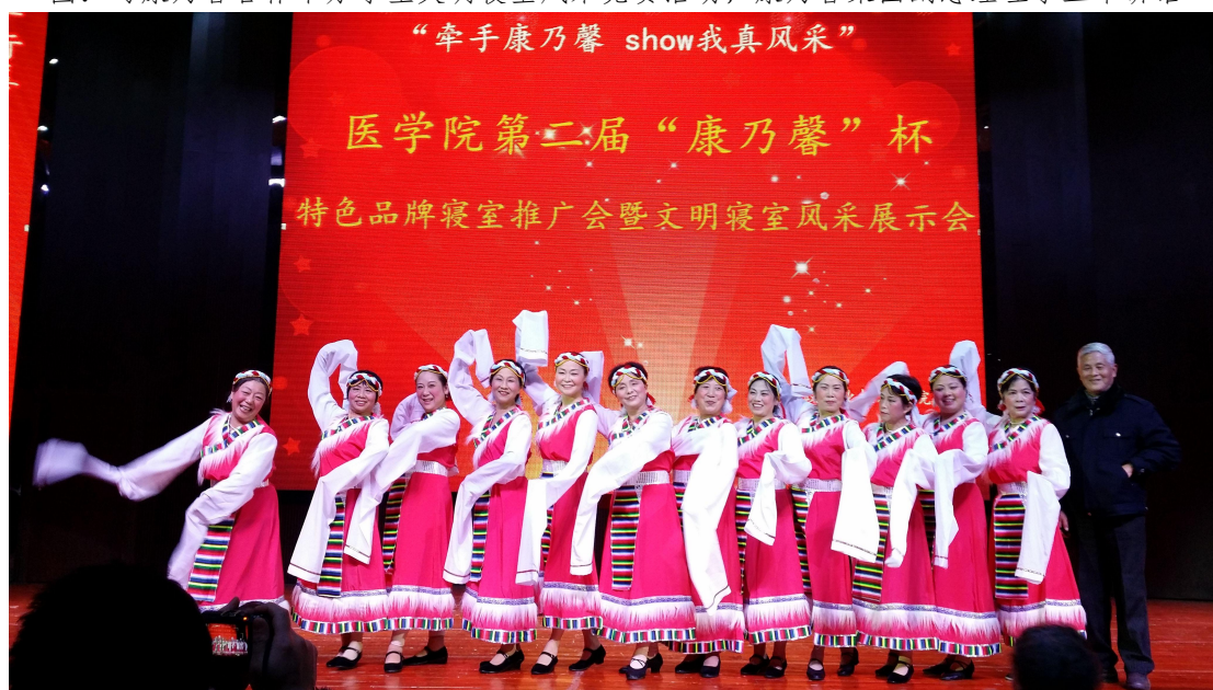
图：与康乃馨合作举办学生文明寝室风采竞赛活动，康乃馨老年公寓老年艺术团表演藏族舞