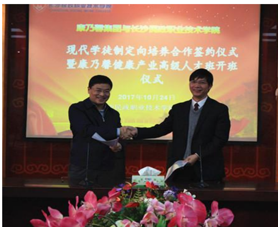
图 现代学徒制定向培养合作协议签约

【案例介绍】 2015年9月15日，长沙民政职业技术学院与康乃馨签订校企人才战略合作协议，开展现代学徒制人才培养、课程体系开发、教学团队共建、企业标准开发在内的几大领域合作。按照企业人才需求，校企“双元”联合培养，共同组织教学和岗位培训。2017年，第一期现代学徒制“康乃馨健康产业高级人才班”开班，招收学员40名。按照“校企合作、工学交替”分段育人培养模式，学生第1学期课程（公共基础课和专业基础课）在校内完成，利用周末到企业见习，使其对企业有基本的认识。第2-4学期1-16周课程在校内完成，17-20周课程在企业完成。第2、4学期21-24周学生到企业实践，专业理论学习和专业技能培训轮替交叉进行。第5-6学期在企业进行顶岗实习，企业对学生进行综合技能培训和考核，学生通过考核，成为企业正式员工。通过校企协作开发现代学徒制课程体系和课程标准，以及校企专家共同参与人才培养全过程，使校企专家共同参与人才培养全过程，按照企业所需求岗位的工作职责、流程设计实施教学计划，企业和学校的导师均直接或间接参与教学计划的组织、实施、检查和调整，使培养的学生更具岗位适用性，毕业后能与企业实现零距离对接。