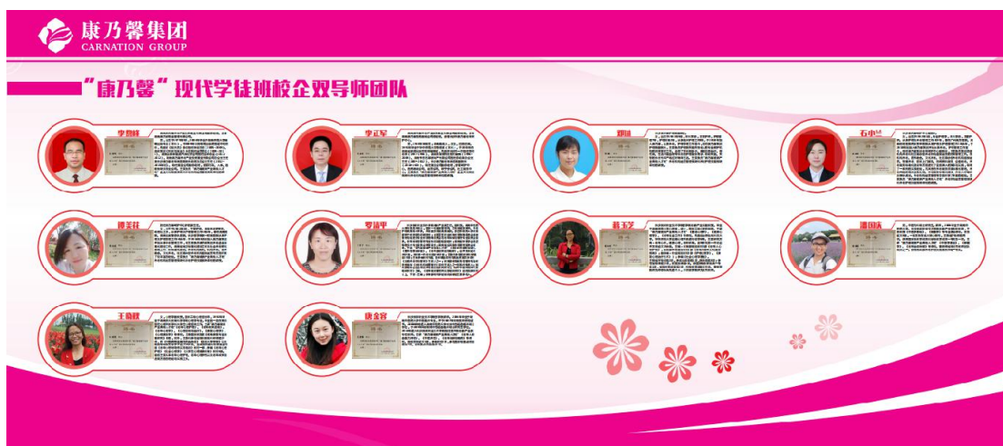
图：康乃馨现代学徒制班企业导师照片墙