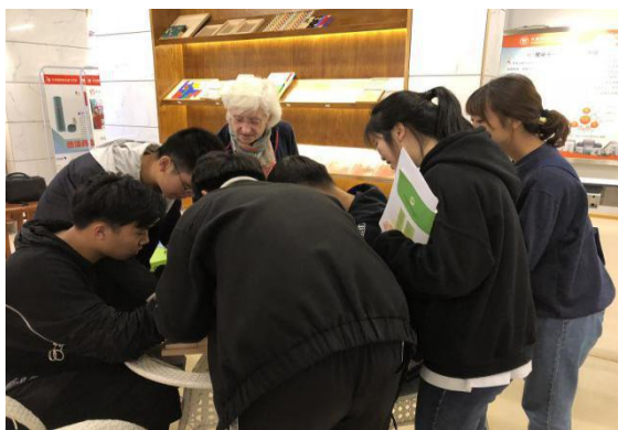
图 贝维斯老师在指导学生

【案例介绍】本年度初，我校成功立项“2018年度省级引进国外智力项目”中的“省级海外名师讲堂专项”，医学院邀请到在国际上享有盛誉的康复医学专家 Sheila purves（希娜·贝维斯）博士给在校的康复治疗技术专业师生做为期10天的“中国康复的国际化进程系列讲座”，本项目成为获批的5个省级“海外名师讲堂专项”之一。通过专题讲座、集体座谈、课堂指导、研讨会、小组讨论等多种形式，Sheila purves老师走进课堂、走上讲台、走进实训室、走进教研室、走进竞赛训练过程，不仅给康复专业师生进行了丰富多彩的专业指导，给予专业建设很多宝贵建议，还为康复专业师生带来丰富的知识盛宴，其中开展大小专题讲座8次，课堂指导2次，专题研讨会2次，专业师生座谈2次，竞赛指导1次，专业建设指导3次。通过本项目的开展，在海外名师国际化视野指导下，使我校康复专业师生开阔了眼界，了解康复医学国际发展的前沿趋势，康复专业建设的最新动态，有力的促进我校康复专业建设，对整体提升康复治疗人才培养水平和质量，有着非常重要的意义。