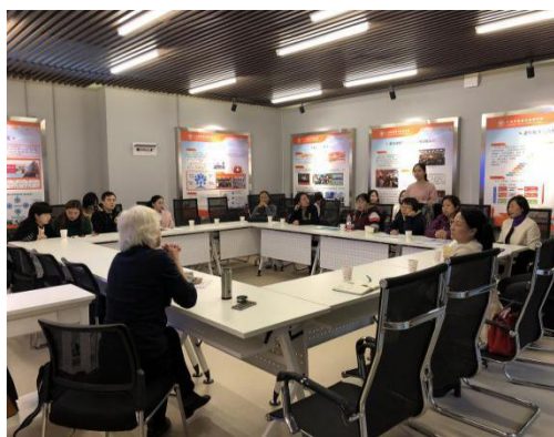
图 贝维斯老师与医学院教师座谈