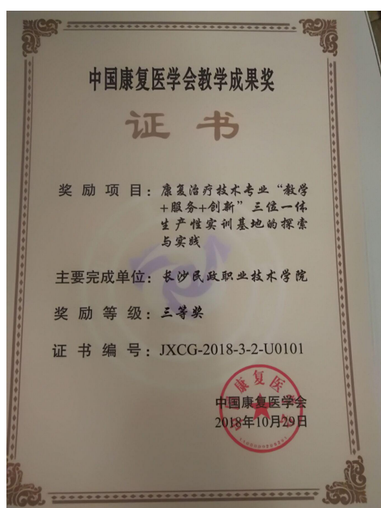
图 中国康复医学会教学成果三等奖

【案例介绍】1997年我校开办了康复治疗技术专业，2000年建立了专业性学生社团“康复中心”。根据中国特色高水平职业院校建设任务，我院在康复中心原有基础上，对生产性实训基地的建设理念、功能设计及管理运营等方面进行了梳理及整合，以提高师生实践能力、社会服务能力及创新能力为目标，为康复治疗技术专业打造了一个集“教学+服务+创新”能力培养于一体的生产性实训基地——康复之家。康复之家一是利用专业自身的优势，面向全校师生提供康复服务，以真实的工作情境，锻炼和提高康复专业师生的实践技能，满足校内实践教学需求；二是将其功能向外拓展，以康复服务为纽带，为学校周边社区群众提供康复咨询、康复教育、康复训练与指导等服务，通过“找服务、多服务、反复服务”的方式，即满足社会需求，体现专业价值，又提升了康复专业师生的实践技能。有效的解决了有效的解决了校内实训缺乏真实工作场景的体验、专业服务能力有限、学生创新能力不足的问题。本生产性实训基地建设探索与实践获评2018年中国康复医学会教学成果三等奖，是高职院校唯一获奖的项目。