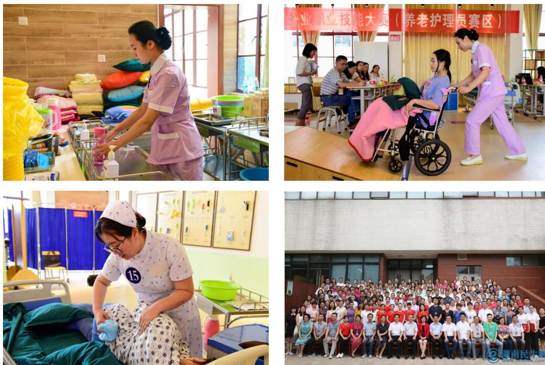
图 养老护理员竞赛

湖南家庭服务业的发展一直备受社会各界关注。为促进全体家庭服务从业人员恪守“把爱心送到家、把服务做到家”的服务理念，不断提高职业素养，为千家万户提供更加优质更加温馨的服务，2018年6月11-14日湖南省人力资源社会保障厅主办了湖南省首届家庭服务业职业技能大赛决赛，我校负责协办其中的养老护理员赛项，护理专业作为主要专业予以协办。湖南省人力资源和社会保障厅副巡视员吕志纲、湖南省人力资源和社会保障厅就业服务局党委书记、局长周光明也莅临赛场，对我校承办的养老护理员赛项给予了高度赞扬。本次技能大赛自启动以来，吸引了全省万余名家庭养老服务从业人员报名参与。决赛期间，来自全省14个市州的养老服务技能“达人”，经过激烈角逐，共产生了一等奖1名、二等奖4名、三等奖6名。此次比赛充分展示了行业形象，激励了广大从业人员爱岗敬业、岗位成才。