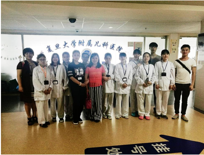
图1 康复治疗专业教学团队深入复旦大学儿童医院调研并就专业课程体系商讨