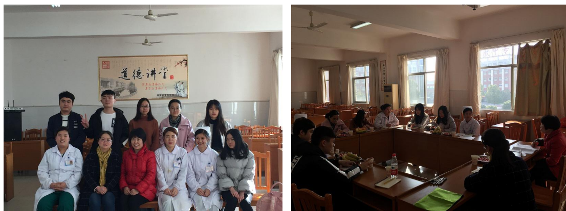
图 6 湖南省荣军医院护理部周主任和我校护理专业实习生座谈

【案例介绍】 湖南省荣军医院是省民政厅直属一所集医、教、研为一体的二级综合性医院，拥有医疗设备资产 7000 万元以上，下设科室 33 个，开放床位 518 张，各类工作人员 481 人，承担了多家医学院校大中专护生的临床教学工作。医院和我校护理系建立了多年的合作关系，每年接收我校数 10-20 名学生临床顶岗实习和就业，实习管理工作认真细致，深得学生好评。