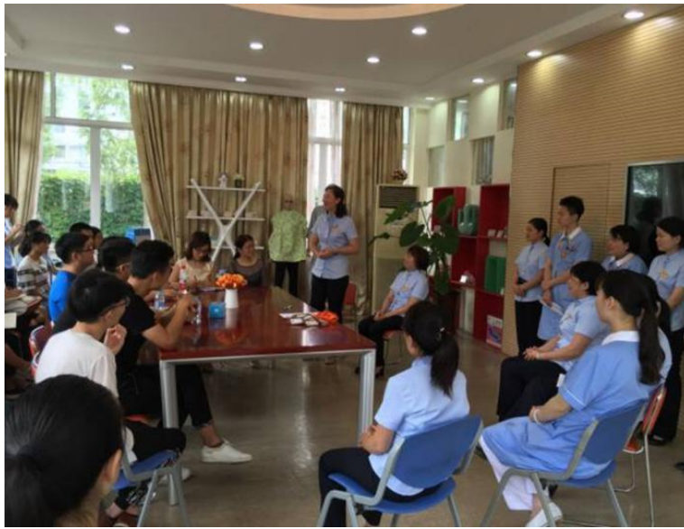
图 4 现代学徒制订单班学员合影