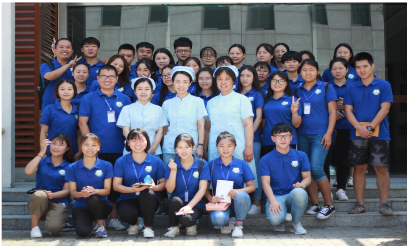
图4 外出考察养老机构合影