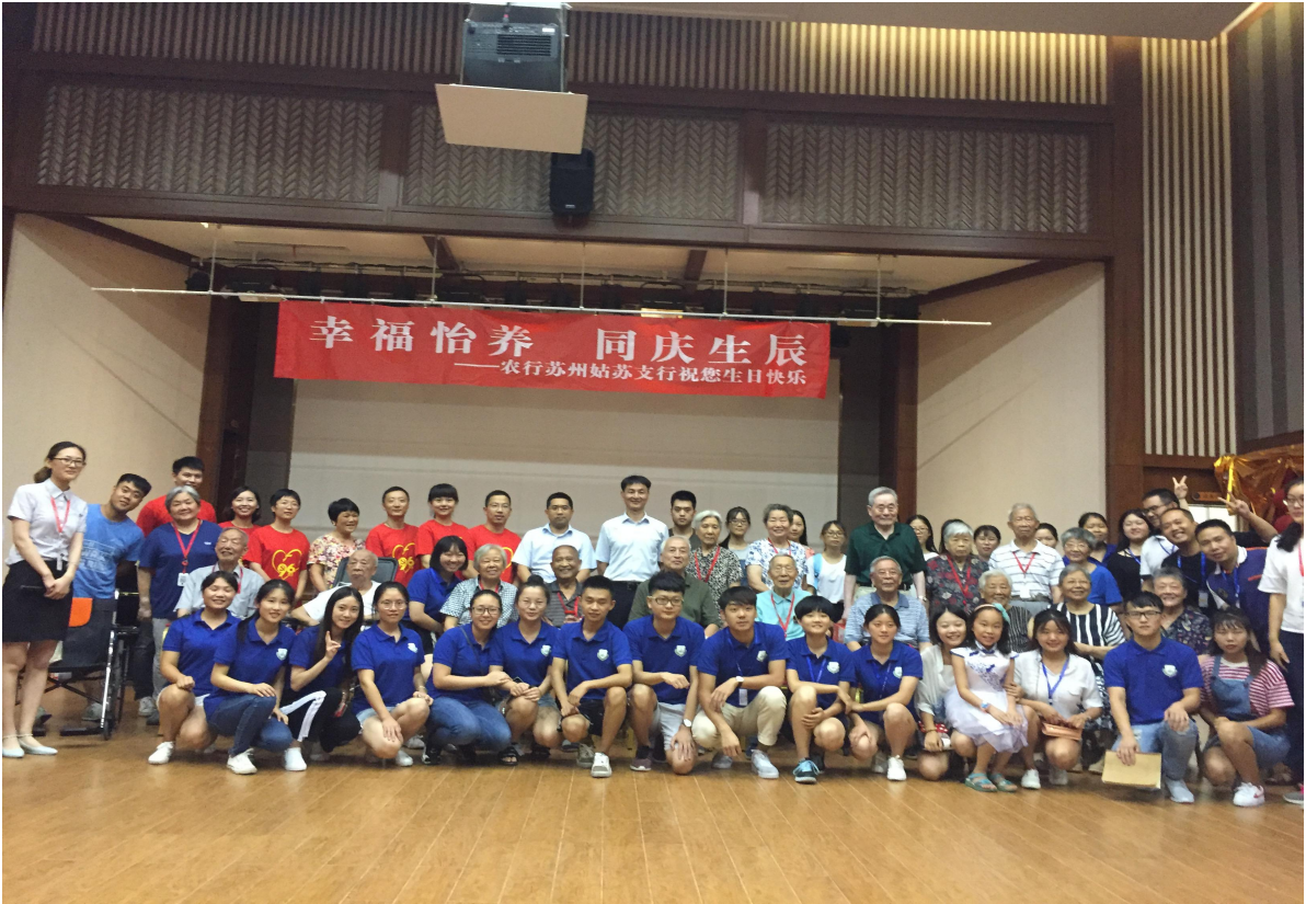
图2 为长者过生日合影