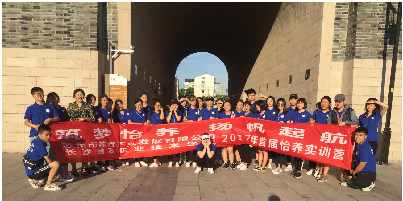
图5 外出素质拓展的合影