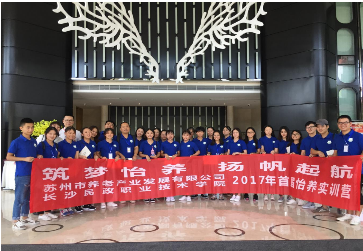
图3 外出考察养老机构合影